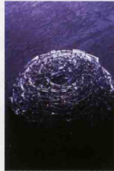
Tangled thinking 02

2001年倉敷芸術科学大学 芸術学部工芸学科ガラス 工芸コース卒。2003年 富山ガラス造形研究所研 究科卒。2006年~専門学 校ルネサンスアカデミー 非常勤講師。2004年第 2回現代ガラス展 in おのた 審査員賞受賞。