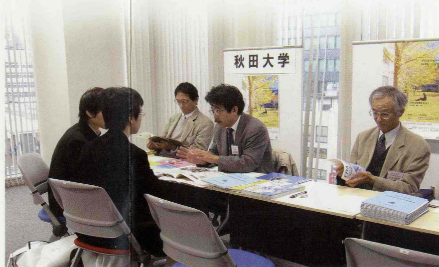
平成20年12月14日、東京で、7連携校の参加により「秋田の大学入試説明会 in 東京」を開催しました。

4 PROJECT 八郎湖の水質改善をめざした基礎的総合研究 —水質改善と地域資源の循環利用をめざして—