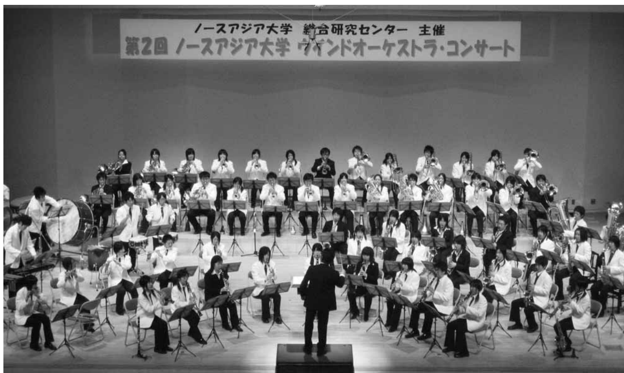
第2回ノースアジア大学ウインドオーケストラ・コンサートの様子 平成20年6月7日 秋田県民会館にて

いろいろな出会いを大切に、今回の演奏会もそのような楽しさが響きわたることを願っております。今後も音楽を通して地域の皆様とつながっていけたら幸いです。